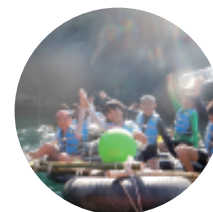
8月 しずおか未来学園