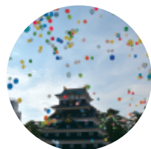
4月 まちづくり事業