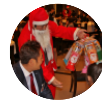
12月 クリスマス家族会